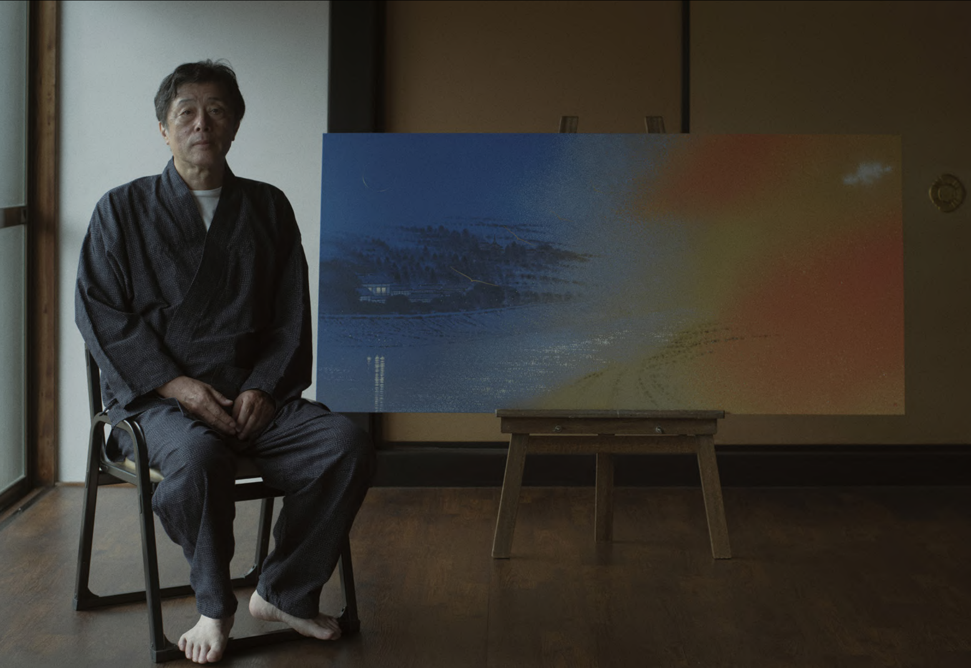
这幅作品贯穿 PAÑPURI Holiday 2026: 节日臻礼系列，为整个静影烛光系列增添一抹细腻的艺术气息，成为节日礼赠体验中温柔的陪伴——随光而动，也与光同行。

在 Luminous 作品中，Kazu Saito 将这两种元素交织在一起，捕捉那些“停留在心中的瞬间”。如同静影烛光系列的香气，他的画作记录了光线流动的轨迹，也凝住了万物将初未始的那一刻。